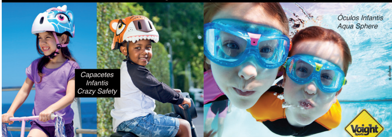
Capacetes Infantis Crazy Safety

Incentive as crianças a praticarem esportes.