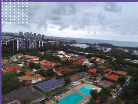
APARTAMENTO NOVO LEBLON 3 QTS R$ 1.350.000,00