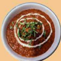
Chicken Tikka Masala