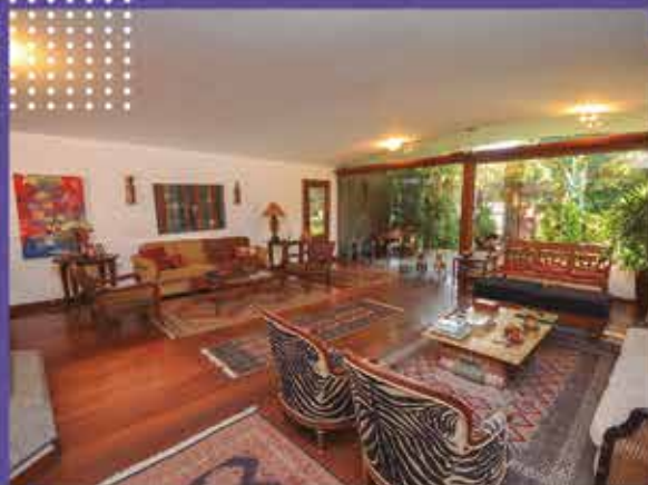
CASA NOVO LEBLON R$ 4.200.000,00 TERRENO 1.000M 2