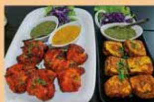
Chicken Tikka & Paneer Tikka