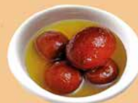
Gulab Jamun (sobremesa)