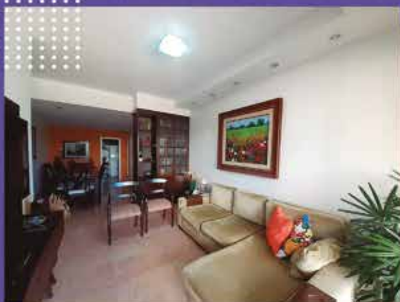
APARTAMENTO NOVO LEBLON 3 QTS R$ 1.380.000,00