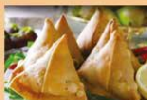
Pastel Vegetable Samosa

Pratos a base de carne de frango, cordeiro e vegetarianos, para todos os gostos e sabores.