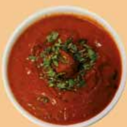
Mutton Roghan Josh