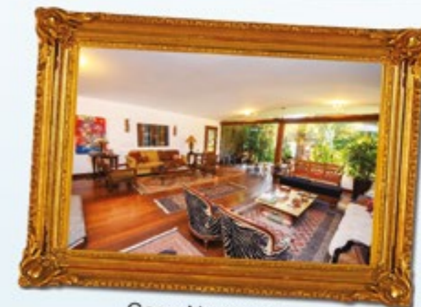
Casa Novo Leblon R$ 4.200.000,00 Terreno 1.000m²