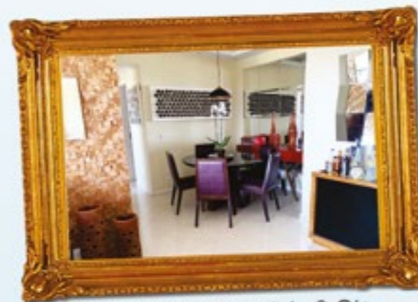
Apartamento Mandala 3 Qts R$ 1.190.000,00

Para comprar ou vender imóveis na Barra, consulte-nos.