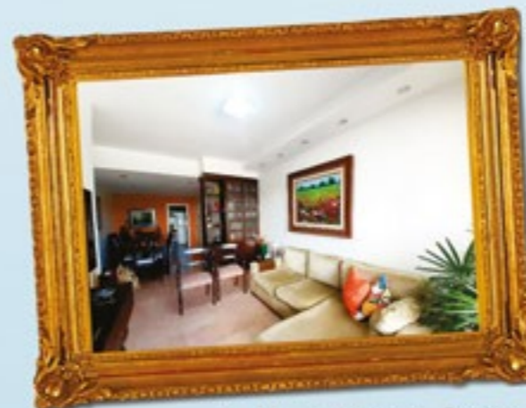
Apartamento Novo Leblon, 3 qts R$ 1.400.000,00