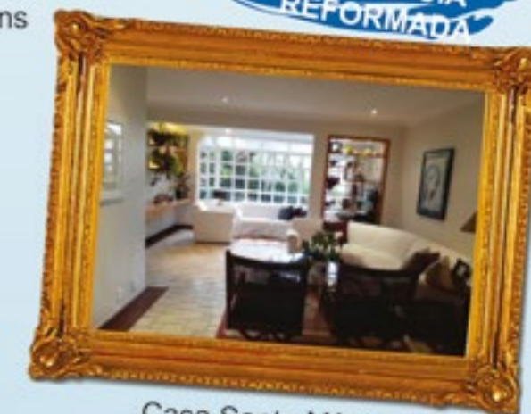
Casa Santa Mônica R$ 2.500.000,00 Reformada