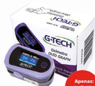
OXÍMETRO GTECH OLED