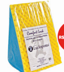
ENCOSTO ORTOPÉDICO LUCKSPUMA