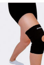
JOELHEIRA ORIFÍCIO MERCUR