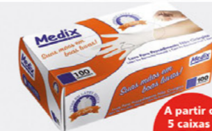
LUA DE PROCEDIMENTO MEDIX Caixa unitária: R$ 74,90