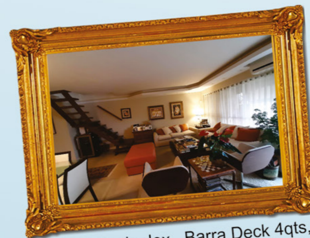
Cobertura duplex, Barra Deck 4qts, reformada, 278m 2 R$ 2.500.000,00