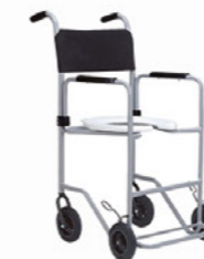
CADEIRA DE BANHO POP JAGUARIBE