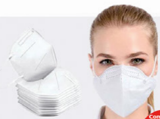
MÁSCARA KN95 Unitária 5,99

Comprando Caixa c/30 a unidade sai R$ 5,33