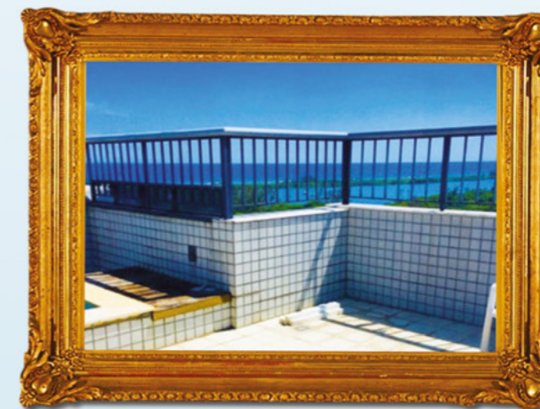
Cobertura Mandala - Lagoa Dourada, 3qts. vista cinematográfica R$ 1.800.000,00