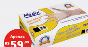
LUA VINIL MEDIX