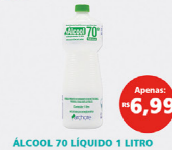
ÁLCOOL 70 LÍQUIDO 1 LITRO