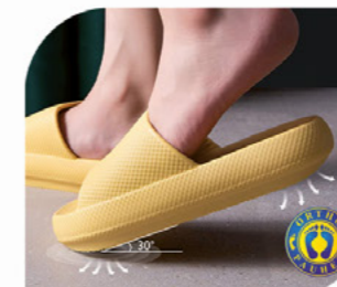
SANDÁLIA FLY FEET