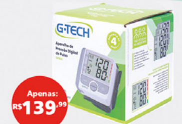
APARELHO DE PRESSÃO GTECH