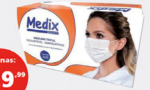
MÁSCARA TRIPLA MEDIX C50