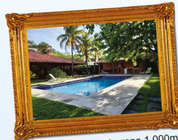
Casa Novo Leblon , terreno 1.000m 2 R$ 4.200.000,00

Para comprar ou vender imóveis na Barra, consulte-nos.