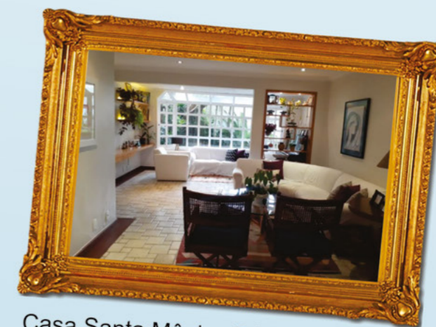
Casa Santa Mônica R$ 2.500.000,00