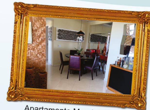
Apartamento Mandala 3 qts. R$ 1.190.000,00