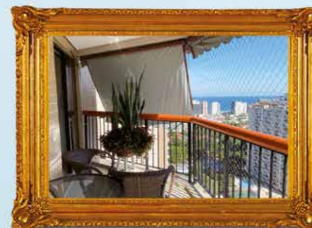
Parque das Rosas - Lindo apto 2 qts, 1 suíte com closet, andar alto, vista mar. R$ 995.000,00