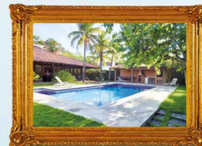
Novo Leblon Casa de 2 pavimentos, 5qts com 2 sts, terreno de 1.000m². R$ 4.500.000,00