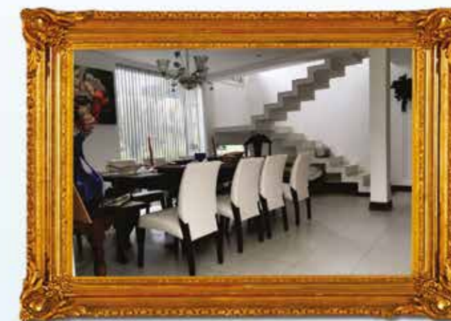
Novo Leblon - Casa, 2 pavimentos, 4qts, com 3 sts, em terreno de 1.000m². R$ 4.800.000,00