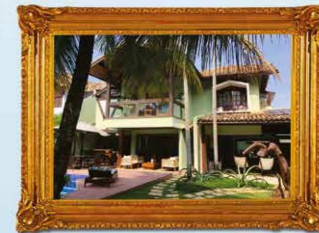
San Diego - Ótima casa em local privilegiado, 3 suítes com closet, living em vários ambientes. R$ 3.500.000,00