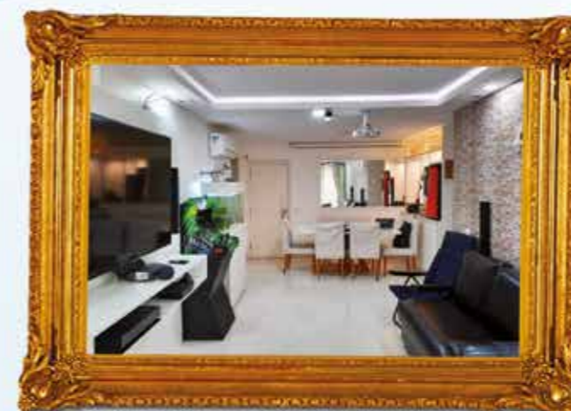
Santa Mônica Special - Lindo apto finamente decorado, 4qts com 1 suíte. R$ 1.350.000,00

Para comprar ou vender imóveis na Barra, consulte-nos.