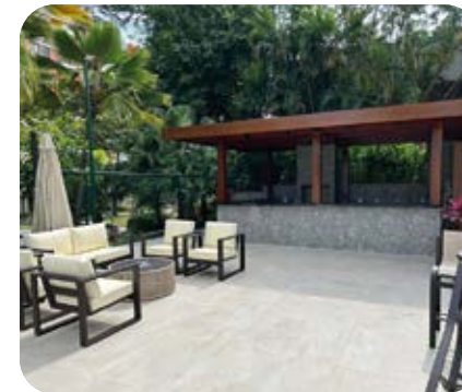
Bar da piscina