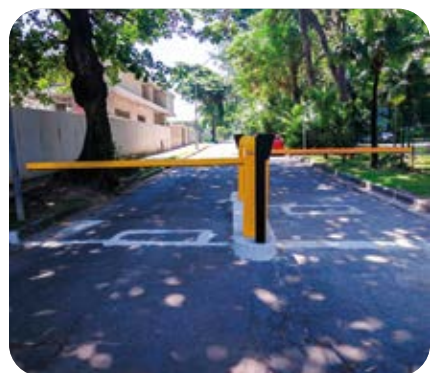
Guarita - P10