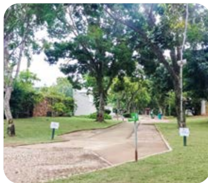
Praça de passagem