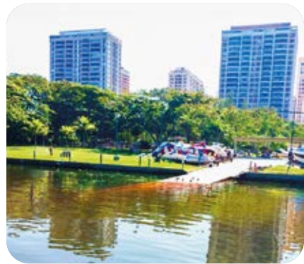
Rampa da marina

Com todas essas conquistas só podemos concluir que aqui é o melhor lugar para se morar onde você gostaria de passar suas férias! Confira algumas de nossas importantes conquistas: