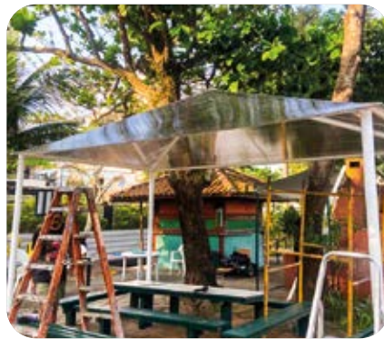
Cobertura do Areal