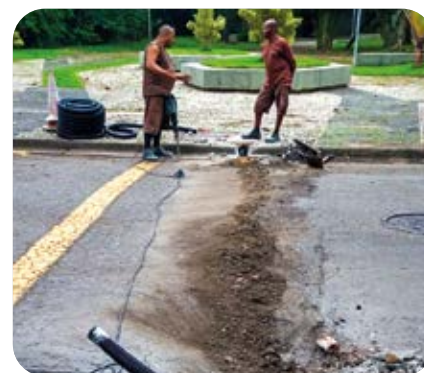
Instalação de mais câmeras