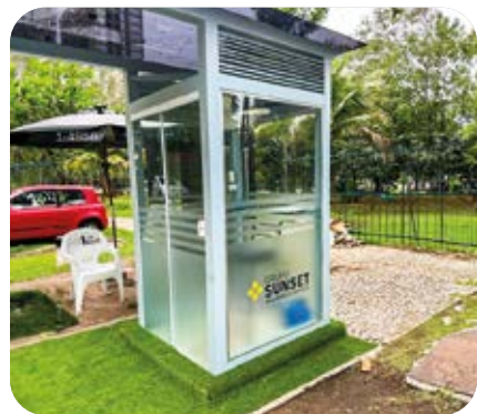
Guarita - HG