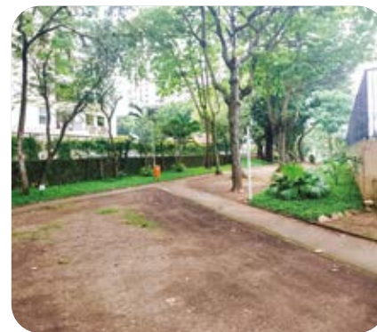
Praça do X