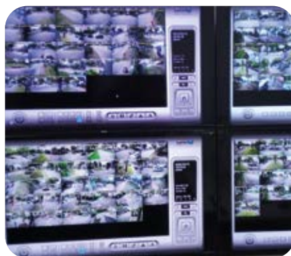
Sala de monitoramento