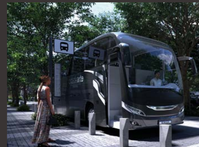
Ônibus do condomínio