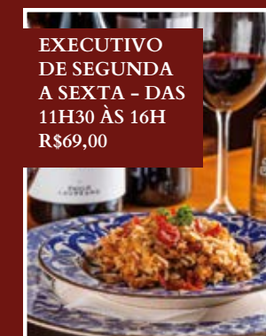
EXECUTIVO DE SEGUNDA A SEXTA - DAS 11H30 ÀS 16H R$69,00