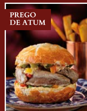
PREGO DE ATUM